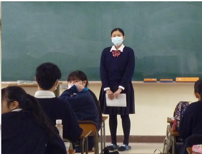
テニス部の友達と