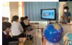
●International Exchange Event Crosscultural Event