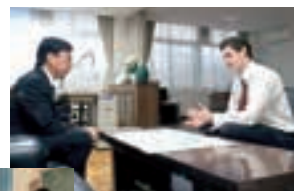
●AFS Semester Student Acceptance