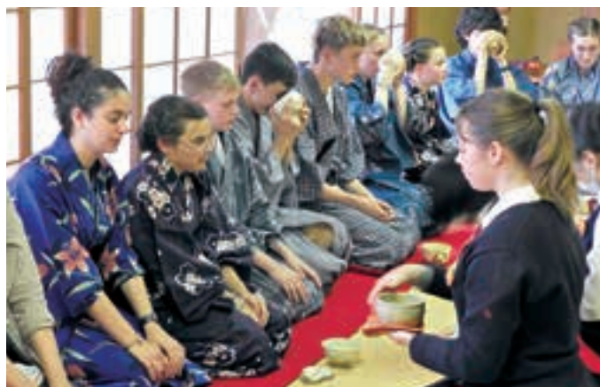
●AFS Student and Elwood Student (Tea Ceremony Experience) Tea Ceremony Experience