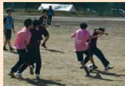
大東杯争奪春季球技大会