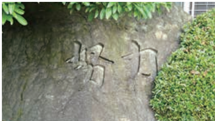
●校訓碑 / School Motto Monument