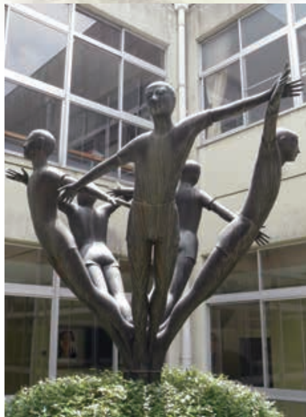
●希望の樹 / Monument of "Tree of Hope"