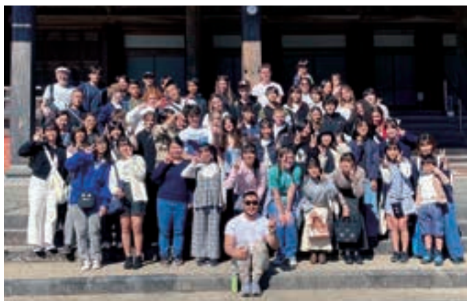
●Elwood School Short-term Admission (Distance) The Sister School Visit by Elwood College