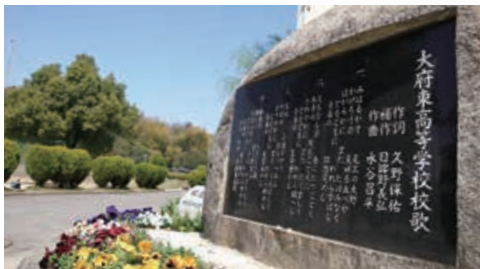
●校歌碑 / School Song Monument