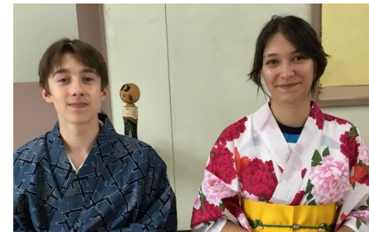
文化祭：茶道体験（姉妹校エルウッドカレッジの留学生と）